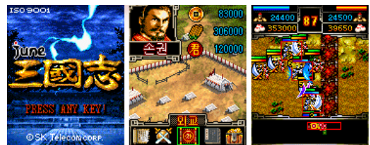
그림 1. 준삼국지 게임화면