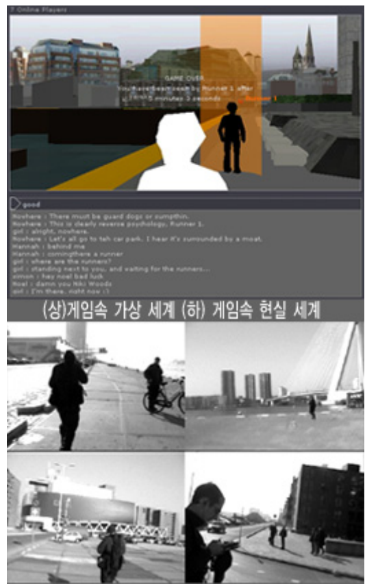
그림 2. Can You See Me Now? 게임인터페이스 및 게임 장면

인 플레이어들의 텍스트 메시지를 보고 현재 그들이 가상공간상에 어디에 있고 어디로 이동하는 지를 예측해 볼 수 있다. 그러나 온라인 플레이어와 도망자들 사이에는 서로 직접 커뮤니케이션은 할 수 없다. 도망자들은 자기들끼리 위키 토키를 통해, 온라인 플레이어들은 텍스트메세지를 통해 서로 협력하여 플레이 할 수 있다.온라인 플레이어 주변 5m안에 도망자가 들어오면 그 화면의 사진이 찍혀지고 게임은 종료된다[9].