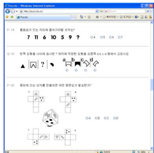
그림 1. 컴퓨터 매개환경에서의 과제제시 화면 예

실험에 이용된 과제는 적당한 도전감과 흥미를 느낄 수 있도록 88개 문항의 퍼즐을 이용하여 제작하였다. 퍼즐은 [그림 1]처럼 도형과 수리, 논리퍼즐형태로 되어 있으며, 난이도를 다양화하기 위해 청소년용의 낮은 난이도를 가지는 문제(17 문항)[24][25]와 보통 성인이 1~2분 정도의 풀이 시간을 요하는 문제(71문항)[26][27]들을 혼합하여 구성하였다.